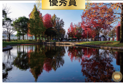
「君の住む町」 ◆ユーザー名◆ @883.evo