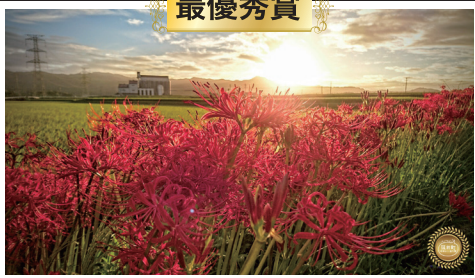
「朝日と彼岸花」 ◆ユーザー名◆ @terrapapa1964